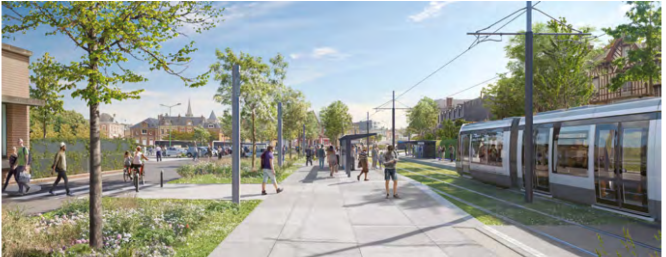
La future station Cité des Abbesses à Montivilliers