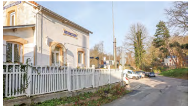
Les accès à la halte ferroviaire bientôt réaménagés

À partir de l'été 2025, la halte ferroviaire de Saint-Laurent - Gainneville va bénéficier d'aménagements destinés à améliorer l'accueil des usagers et favoriser leur stationnement, tous