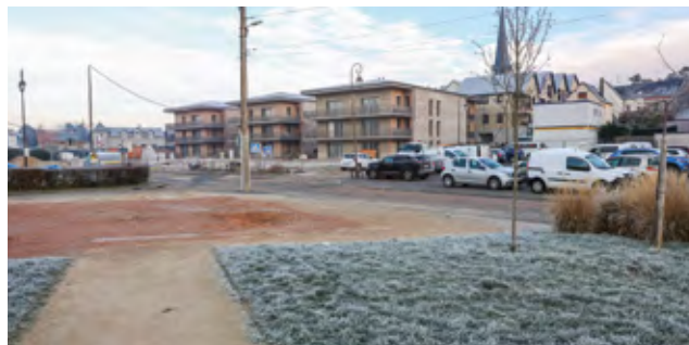
Le secteur de l'ancienne Poste à Octeville-sur-Mer

La ville d'Octeville-sur-Mer a souhaité densifier son centre-bourg sur trois secteurs, dont celui de la place de l'ancienne Poste. La requalification de l'espace public autour des rues Abbé-Jean-Ribault, Fafin, René-Coty et Verdun ainsi que de la place Maréchal-Foch s'effectue en miroir des programmes immobiliers (67 logements et trois commerces) qui y sont