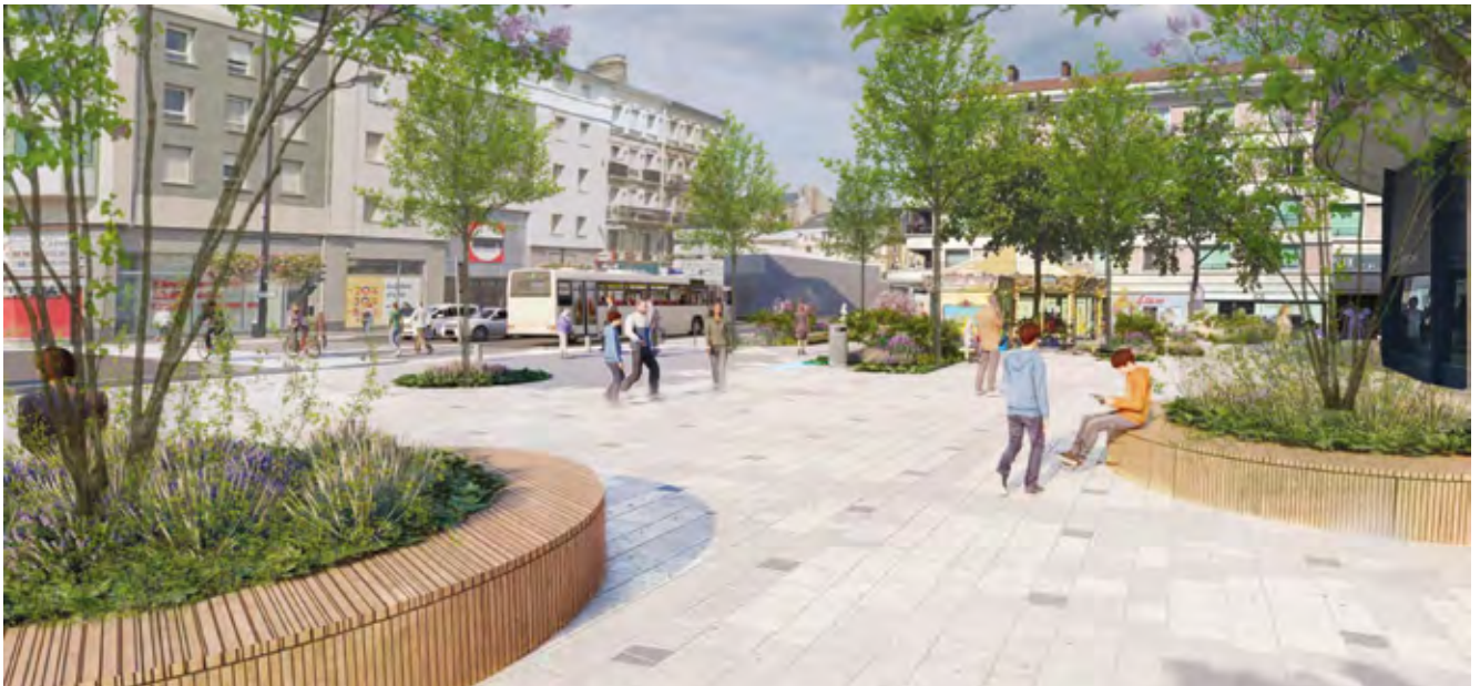
Perspective des aménagements prévus dans le secteur Thiers-Coty-Flaubert au Havre

La Communauté urbaine exerce, à l'échelle des 54 communes, sa compétence d'aménagement du territoire. Pilote en matière de voirie et de mobilité, elle investit pour préserver le domaine public routier et améliorer le quotidien de tous les habitants.