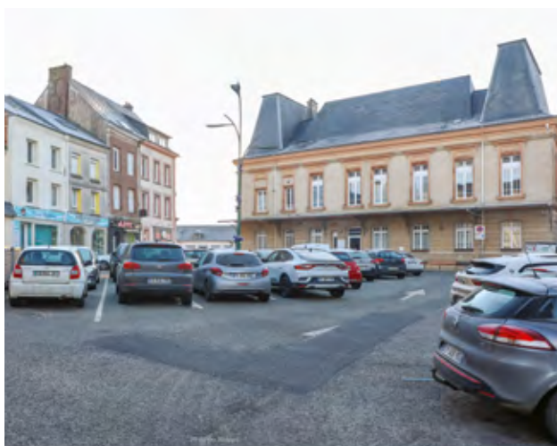
À Criquetot-l'Esneval, la place Georges-Chedru prépare sa mue.

Le projet d'aménagement des places Georges-Chedru et Général-Leclerc débutera en juin 2025. Il permettra d'améliorer l'accès aux commerces et la cohabitation des différents usagers du centre-bourg (piétons, cyclistes, automobilistes), avec une grande place accordée aux piétons. Ce projet, qui devrait être livré en septembre 2025, prévoit de végétaliser davantage l'espace public et mettre en valeur le patrimoine communal.