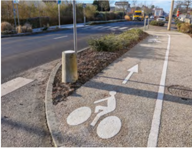
De nouveaux aménagements pour les cyclistes à Saint-Romain-de-Colbosc