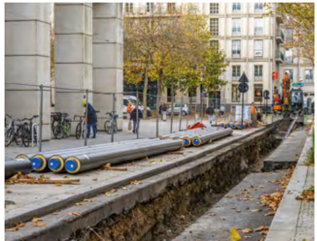
Les travaux d'extension du réseau de chaleur au Havre

Le Havre Seine Métropole veille au bon fonctionnement du réseau de distribution d'eau et d'assainissement. Cela se traduit également par des travaux impactant la voirie. Ainsi au Havre, durant le premier semestre 2025, se poursuivent les travaux sur le réseau structurant d'eau potable circulant sous l'avenue Foch, le boulevard de Strasbourg et jusqu'au quai Colbert. Vieux de près d'un siècle, ce réseau est progressivement remplacé par un réseau parallèle, concomitamment, là où c'est possible, avec le chantier d'extension du réseau de chaleur. Les travaux en cours jusqu'à l'été 2025 concernent le secteur compris entre le quai George-V (au niveau de la place du Général-de-Gaulle), l'église Saint-Joseph et l'avenue Foch.